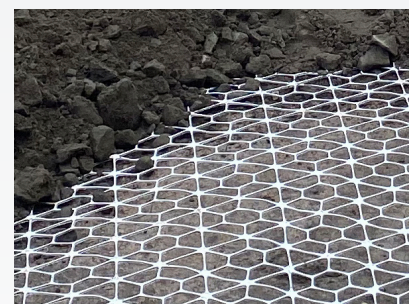
Tensar® InterAx® NX750